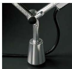
Desk fixed support