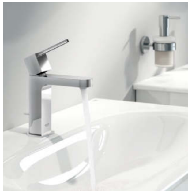
32 612 003* S-Size, Einhand-Waschtischbatterie mit Zugstangen-Ablaufgarnitur

Ganz gleich, ob Ihr Bad in zeitloser Eleganz oder einem minimalistischen Stil glänzt: GROHE Plus passt perfekt. Das GROHE Plus Sortiment umfasst eine breite Auswahl an Größen – von der Waschtischarmatur über wandmontierte Varianten bis zur atemberaubenden freistehenden Armatur für die Badewanne.