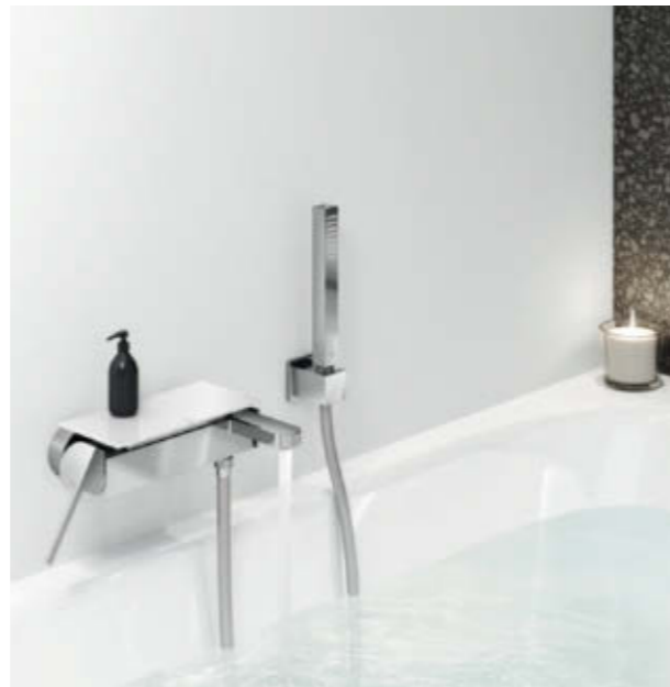
33 547 003* + 40 954 000* Einhand-Wannenbatterie mit Brausegarnitur + Duschatlage