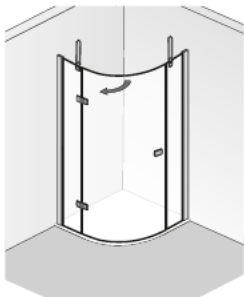
Abb.: Anschlag links