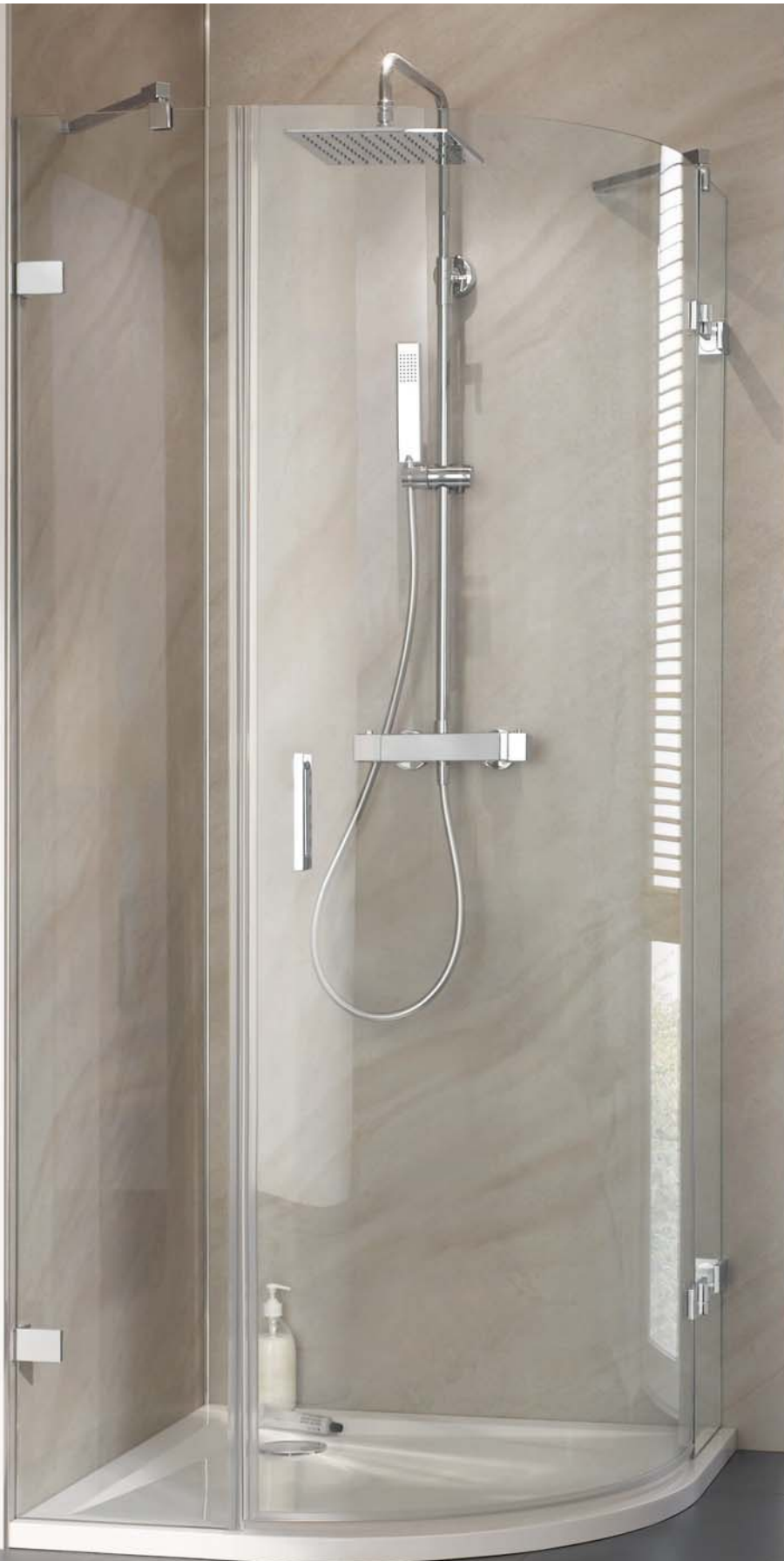
Runddusche, 3-teilig mit RenoDeco-Dekor Feinstein, travertin-beige