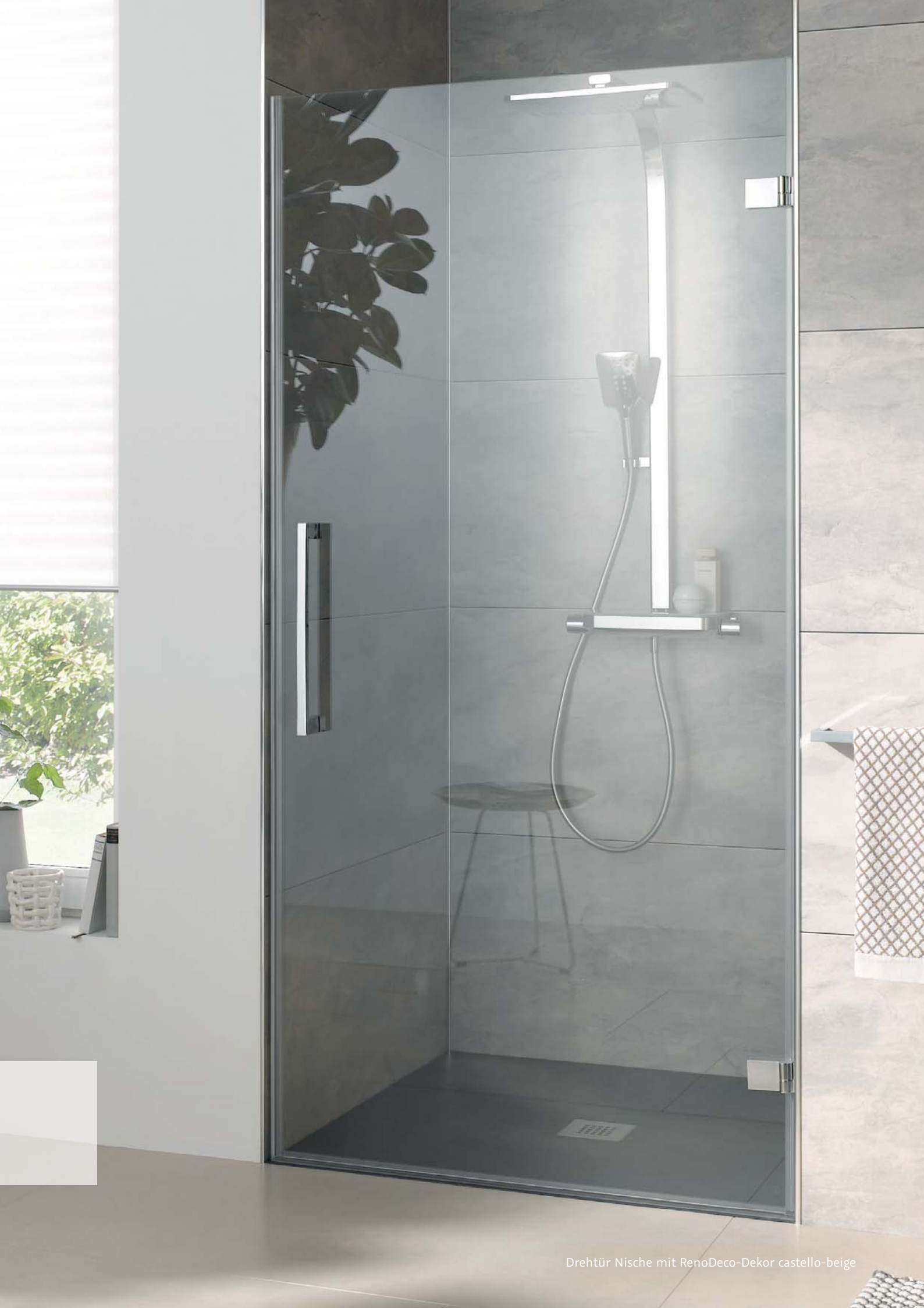
Drehtür Nische mit RenoDeco-Dekor castello-beige