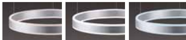
warmweiß/ warm white 2700K