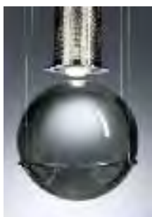
HL3S 81 Chr

Hängeleuchte „Le tre streghe“ Pendant lamp „Le tre streghe“