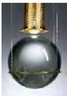
HL3S 81 Go