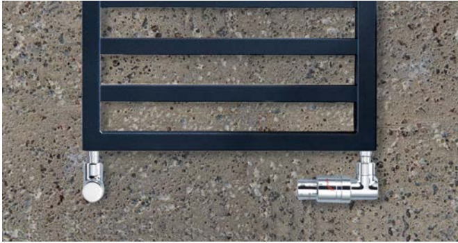
Ausführung Warmwasserbetrieb mit Anschlüssen rechts, links.