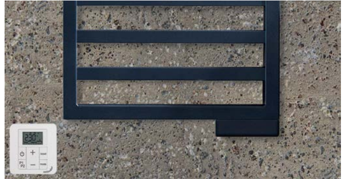
Ausführung Elektrobetrieb inklusive Steuergerät.

V20210601, RAD_DAS, DE_de, Änderungen vorbehalten